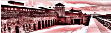
Vorstellung des Programms

Themeneinteilung und Organisation in Kleingruppen