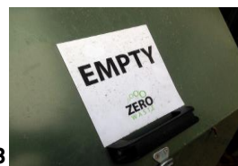
Empty of zero waste

20.00 Uhr Entschleunigung konkret mit Spiel und Spaß oder im Thermalbad *