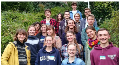
Die FÖJ-Sprecherinnen und -Sprecher 2018/2019 aller FÖJ-Träger in Baden-Württemberg beim ersten gemeinsamen Sprecher*innen-Treffen im Oktober 2018.

Wir freuen uns über diese Auszeichnung und wollen auch in Zukunft die Qualität unseres FÖJ sichern und weiter entwickeln!