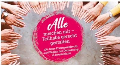
Aktionstag "Alle mischen mit - Teilhabe gerecht gestalten" am 04. Juli in Offenburg (Foto: Titelbild des Flyers zum Aktionstag)