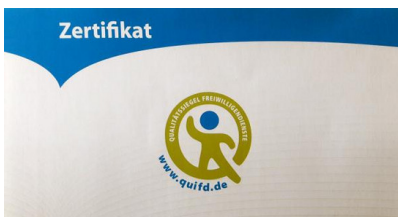
Zertifikat: Quifd-Qualitätssiegel für Trägerorganisationen von Inlandsfreiwilligendiensten für das Freiwillige Ökologische Jahr bei der LpB.

Ausführliche Infos und Anmeldung (bis 21.06.): Programm und Anmeldung